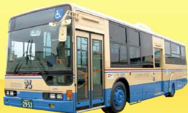
阪急バス・阪急田園バス